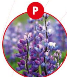
P LUPINEN UND DARAUSS GEWONNENE ERZEUGNISSE

z.B. Fruchtzubereitungen, Müsli, Brot, Fleischerzeugnisse, Feinkostsalate, Suppen, Soßen, Sauerkraut, Fruchtsaft, Chips und andere getrocknete Kartoffelerzeugnisse, gesalzener Trockenfisch