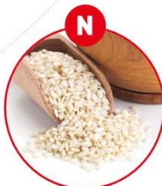
N SESAMSAMEN UND DARAUSS GEWONNENE ERZEUGNISSE

z.B. Fleischerzeugnisse, Feinkostsalate, Suppen, Soßen, Dressing, Mayonnaise, Ketchup, eingelegtes Gemüse und Gewürzmischungen, Käse, Essiggurken