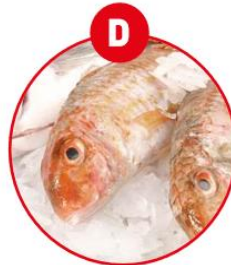
D FISCH UND DARAUS GEWONNENE ERZEUGNISSE (AUSSER FISCHGELATINE)

z.B. Eierteigwaren, panierte Speisen, Mayonnaise, Palatschinken, Kuchen, Gebäck, Brot, Nudeln, Croutons, Fascierter Braten, Burger, Feinkostsalate, Pasteten, Quiches, Soßen, Dressings, Desserts