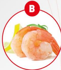
B KREBSTIERE UND DARAUS GEWONNENE ERZEUGNISSE

z.B. Brot und Gebäck, Kuchen, Teigwaren, Suppen, Soßen, Paniermehl, Semmelbrösel, Würstwaren, Backwaren, Frischkornbreie, Desserts, Schokolade