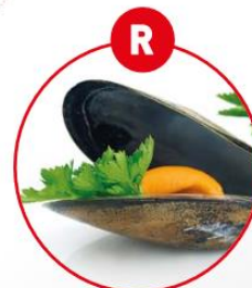
R WEICHTIERE WIE SCHNECKEN, MUSCHELN, TINTENFISCHE UND DARAUS GEWONNENE ERZEUGNISSE

z.B. Brot, Gebäck, Pizza, Nudeln, Snacks, fettreduzierte Fleischerzeugnisse, Fleischersatz/vegetarische Produkte, glutenfreie Produkte, Desserts, milchfreier Eiersatz, Kaffeeersatz, Flüssiggewürze