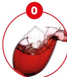
O SCHWEFELDIOXID UND SULFITE

z.B. Brot, Knäckebrot, Gebäck (süß und salzig), Müsli, vegetarische Gerichte, Falafel, Salate, Humus, Feinkostsalate, Marinaden, Desserts