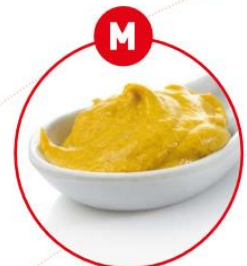
M SENF UND DARAUS GEWONNENE ERZEUGNISSE

z.B. Suppengrün, Gewürzbrot, Wurst, Fleischerzeugnisse, Fleischzubereitungen, Kräuterkäse, Fertiggerichte, Feinkostsalate, Brühe, Suppen, Eintopf, Marinaden, Gewürzmischungen, Curry, salzige Snacks (Chips)