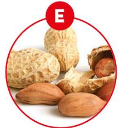
E ERDNÜSSE UND DARAUS GEWONNENE ERZEUGNISSE

z.B. Kräcker, Soßen, Suppen, Würzpasteten, Würste, Surimi, Sardellenwurst, Brotaufstriche, Feinkostsalate, Pasteten, Vitello tonnato