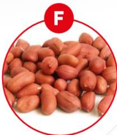
F SOJABOHNEN UND DARAUS GEWONNENE ERZEUGNISSE

z.B. Margarine, Brot, Kuchen, Gebäck, Schokocreme, Brotaufstriche, Cerealien, Müsli, Frühstücksflocken, Schokolade, Feinkostsalate, Marinaden, Satésaufbe, Eis, aromatisierter Kaffee, Likör, (Pommes Frites)