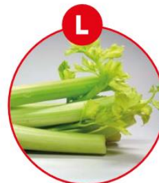
L SELLERIE UND DARAUS GEWONNENE ERZEUGNISSE

z.B. Brot, Kuchen, Gebäck, Brühwürste (Pistazien), Rohwürste (Walnüsse), Pasteten, Feinkostsalate (Waldorff), Joghurt, Käse, Nuss-/ Nougatcreme, Aufstriche, Müsli, Schokolade, Marzipan, Müsliiegel, Kekse, Dressings, Curry, Pesto, Desserts, Likör, aromatisierter Kaffee