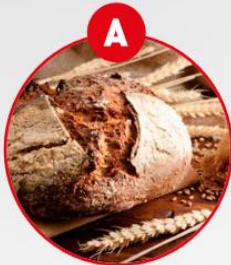
A GLUTENHALTIGES GETREIDE UND DARAUS GEWONNENE ERZEUGNISSE

z.B. Brot und Gebäck, Kuchen, Teigwaren, Suppen, Soßen, Paniermehl, Semmelbrösel, Würstwaren, Backwaren, Frischkornbreie, Desserts, Schokolade