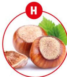
H SCHALENFRÜCHTE UND DARAUS GEWONNENE ERZEUGNISSE

z.B. Brot, Kuchen, Gebäck, Brüh-, Koch-, Roh-, Bratwurst, Feinkostsalate, Margarine, Nussnougatcreme, Müsli, Schokolade, Karamell, Aufläufe, Gratin, Kartoffelpüree, Kroketten, Pommes Frites, Chips, Suppen, Soßen, Dressing, Marinaden, Desserts, Kakao, Wein