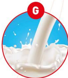
G MILCH VON SÄUGETIEREN UND MILCHERZEUGNISSE (INKLUSIVE LAKTOSE)

z.B. Brot, Kuchen, Gebäck, Feinkostsalate, Margarine, Schokocreme, Brotaufstriche, Müsli, Schokolade, Kekse, Kaugummi, Soßen, Dressings, Marinaden, Mayonnaise, Eis, Sportlernahrung, Diät drinks, Kaffee weißer